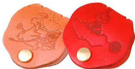
絡まりがちなコード類をまとめら れるコードホルダー。使いむほ どに色艶の増す牛革を使ってい ます。各¥1,500/ハイタイド