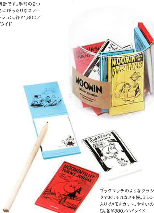
ブックマッチのようなクラシッ クでおしゃれなメモ帳。ミシン目 入りでメモをカットしやすいのも ◎。各¥380/ハイタイド