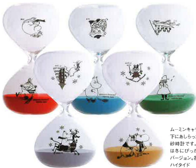
ムーミンキャラクターを上 下にあしらった約15分の 砂時計です。手前の2つ は冬にぴったりのスノー バージョン。各¥1,800/ ハイタイド