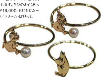
高級感のある華奢なリングは指を細 く長く見せてくれます。ちびのミイ(あ ち、こっち)各¥16,000、もじもじムー ミン¥15,000/ドリーム・ぼけっと