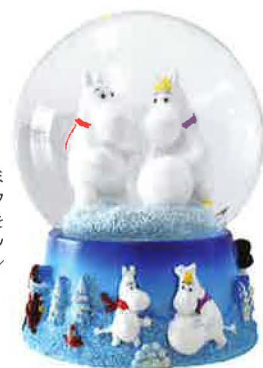
雪に覆われたムーミ ン谷で、ムーミンとフ ローレンが雪だるまを つくるラブリーなスノ ードーム。¥2,900/ ピーオーエス