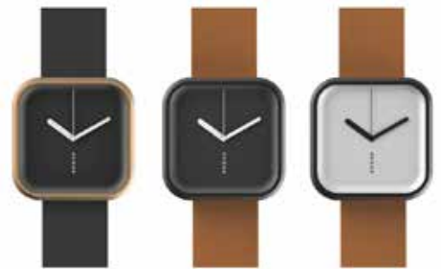
VÄRI SERIES COLOR UPDATE MATS LÖNNGREN NEW COLORS

気鋭のフィンランド人デザイナーが手掛けた「色」を意味する VARI(バリ)。アルミニウムを使用した軽い着けごちと、日常使いしやすいカラーリングが魅力的。33mmの小振りなサイズながら、角の取れたスクエアケースとマットな色調が腕の上で個性を放ちます。