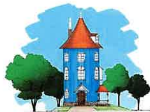
ムーミン屋敷 ガイドツアー

原作を忠実に再現したムーミン屋敷をガイドつきでまわられます。ムーミンの部屋から、ムーミンパパの書斎まで、すべてがリアル! / 料金: ¥1,000(税込)(3歳以下は無料)