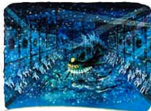
海のオーケストラ号

トーベ・ヤンソンの人生やムーミン作品について、さらに理解を深められる展示施設。北欧輸入のムーミングッズを購入できるセレクトショップも併設/入場無料