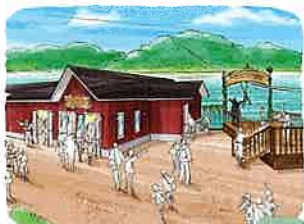
飛行おにのジップラインアドベンチャー

ムーミンバレーパークが面する宮沢湖上を、ジップラインでかけぬけるアトラクション。風をいっぱいを受けて自然を体感できます/料金: ¥1,500(税込)(3歳以下は無料)