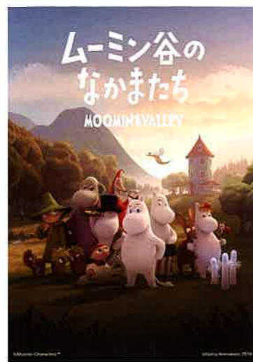
© Moomin Characters™ © Gutsy Animations 2019